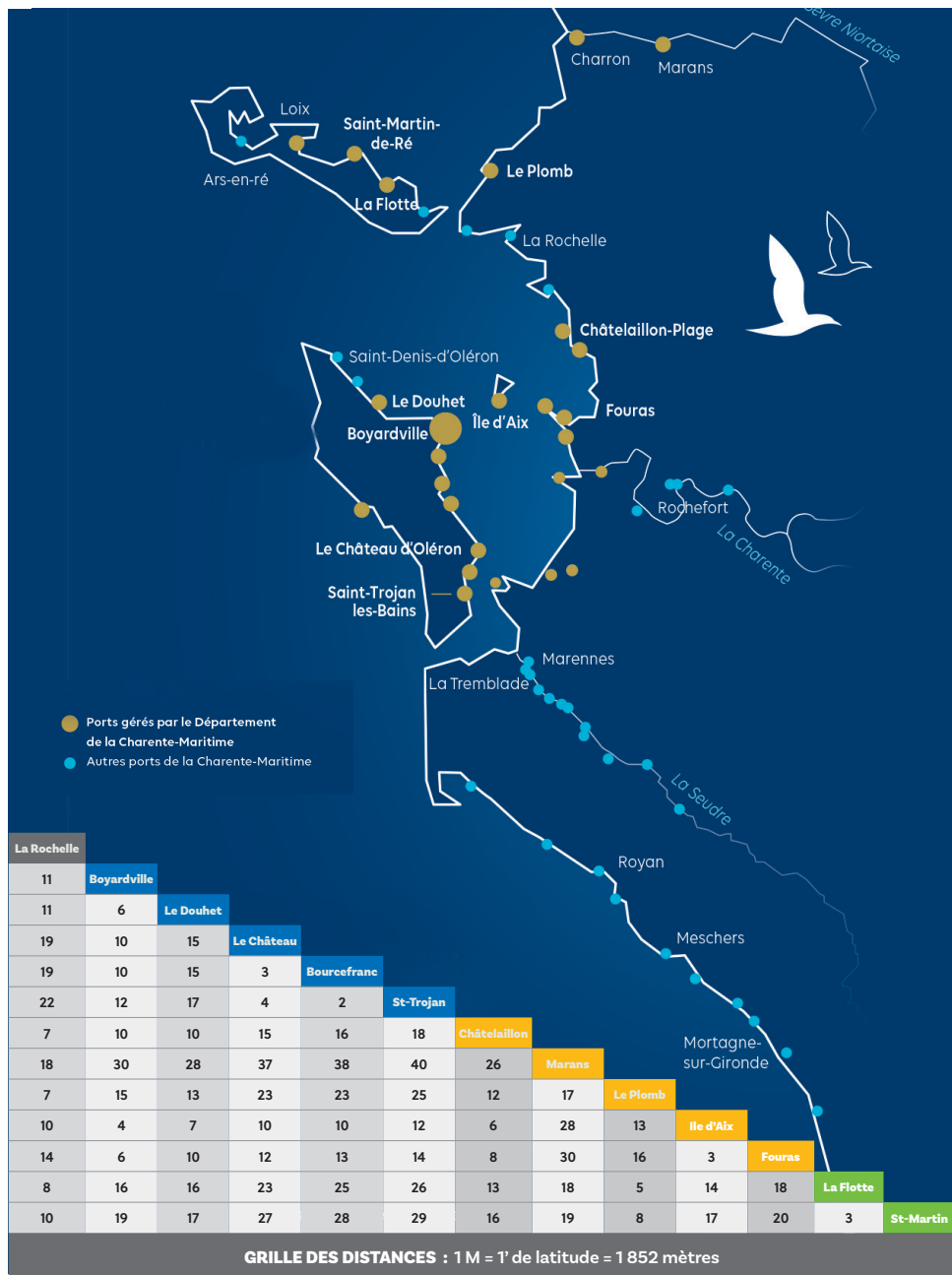
GRILLE DES DISTANCES : 1 M = 1' de latitude = 1 852 mètres